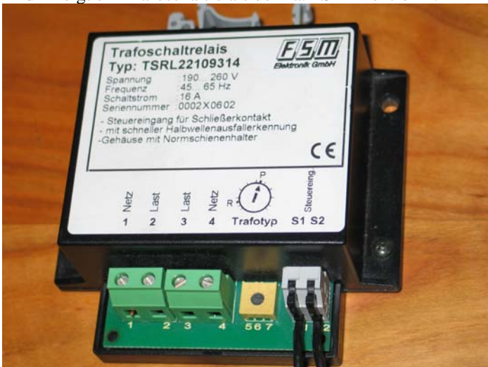
Bild 2 zeigt ein Trafoschaltrelais der Fa. FSM-Elektronik.

wenn ein Trafoschaltrelais , - TSRL - siehe Bild 2, vor den Trafo geschaltet wird. Mit einem patentierten Einschaltverfahren wird das Auftreten von Einschaltstromstößen unter allen Umständen, auch bei Halbwellenausfällen, vermieden.